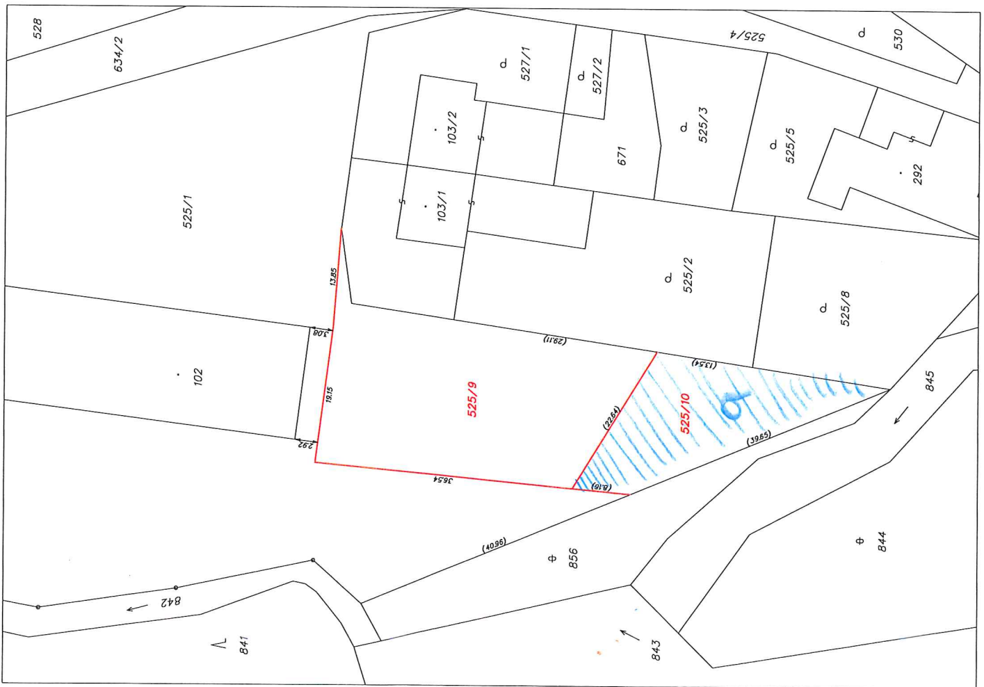
Návrh na rozdělení pozemku